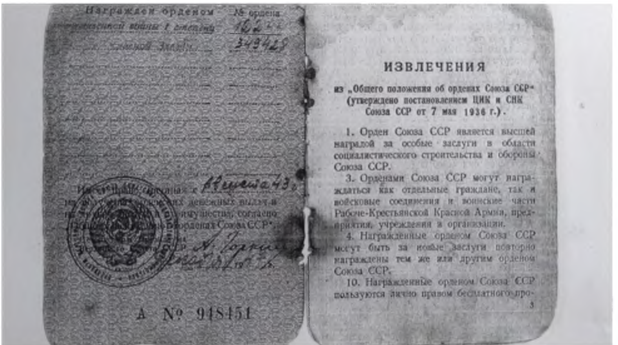
Ордени та орденська книжка Стаханова Є.М.